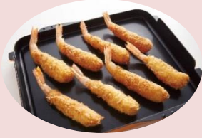
エビフライ (ノンフライ)