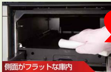
側面がフラットな庫内